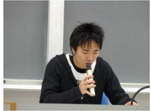
テーマの絞り込みに苦労・・・ 本気に書き始めたのは12月から？！