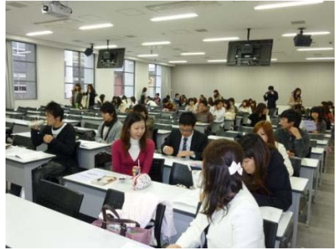
ちょっと緊張・・・ 話す内容を最終チェック！