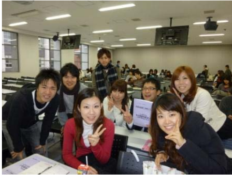
これから皆さんに お話をさせていただきます