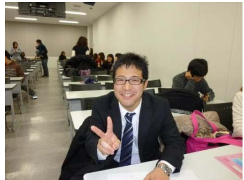
この後、東京へ スーツ姿、バッチリきまってます