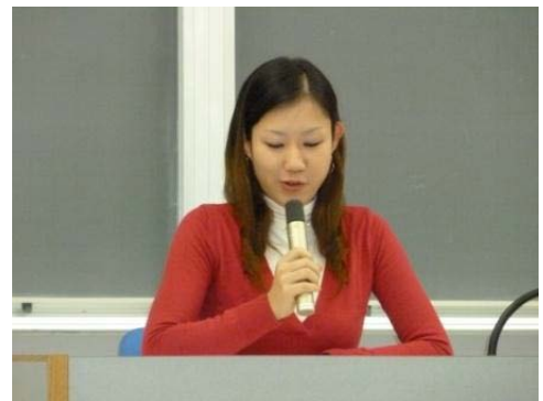
11月末時点で「はじめに」しか書けていなかった・・・ (お話はスラスラと話していましたよ！)