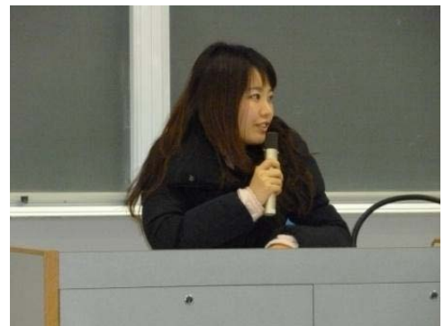
完成した卒論を見て「自分も書けるんだ！」