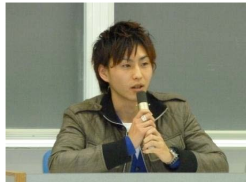
16000字は意外に短い?! (さすが、クールですね...)