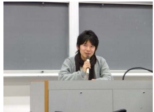
地元の四国も過疎化へ 限界集落とは・・・