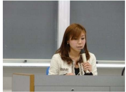
「子どもを大切にしない国に未来はない！」 (この言葉、とても印象に残りました、同感です)