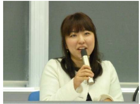
エビデンスにノイローゼ?! (1回生に視線を向けて話していたのが印象的でした)